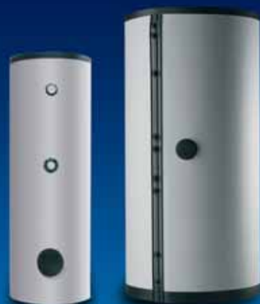
■ Roth Serbatoi d'accumulo solare BW, BW/H e Schichtenladespeicher