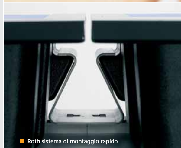
■ Roth sistema di montaggio rapido