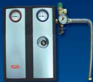
■ Stazione solare Roth