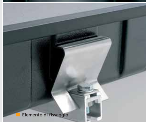
■ Elemento di fissaggio