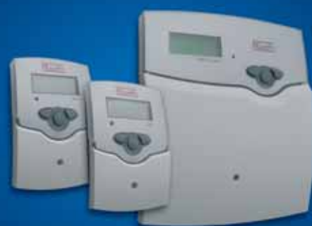
■ Roth Regolatore differenziale BW, BW/H e BW/H Komfort