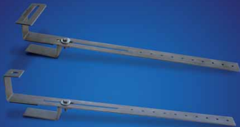
■ Staffa universale Roth